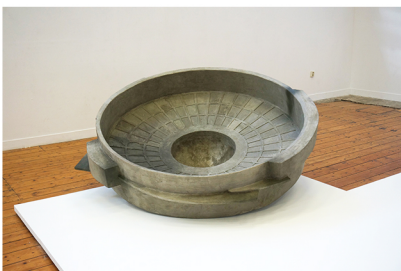
Katleen Vinck Tower of Silence 2021 hout, PU, acrylhars, cement, verf 195 x 77 cm