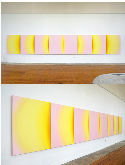
Esther Tielemans Sun 2024 acryl op houten panelen 152 x 918 cm