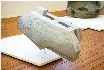
Katleen Vinck Quasi - Archaic 2024 aluminium, RVS 135 x 70 x 65 cm