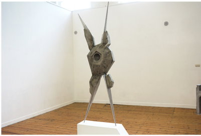
Katleen Vinck Modolor 2024 acrylaathars, cement, verf, PU, aluminium 80 x 35 x 270 cm