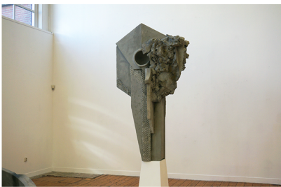
Katleen Vinck Anachronisme 2022 hout, PU, staal, acrylhars, cement, epoxy verf 220 + 80 (plint) x 120 x 60 cm