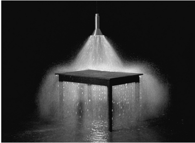
Stream 1999 16mm film, zwart-wit single screen, zonder geluid 3' loop