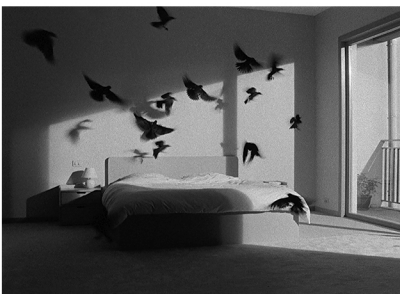
The Black Sun 2022 16mm film, zwart-wit 2-channel, geluid 11'