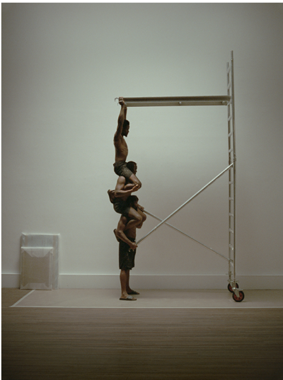
Double Bind 2021 35mm film, kleur single screen, geluid 11'04"

In de film Double Bind worden drie zwarte mannen langzaam maar zeker een noodzakelijk onderdeel van een stelling. Ze worden gereduceerd tot gereedschap en kunnen enkel nog ondersteunen. Het is een zinloze opvoering waarin fysieke grenzen worden opgezocht en die een ongemakkelijke schoonheid in zich draagt.