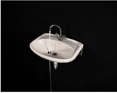
Wasbak 2024 SD video, kleur zonder geluid 7' loop