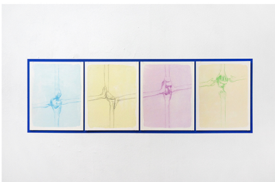
[barruimte] PARK-editie Onverbiddelijke ver- bindingen 2024 4 litho's gebundeld in map elk 25,6 x 20,1 cm oplage 18

In het diptiek Black Sun zien we twee keer dezelfde slaapkamer die bezoek krijgt van vreemde indringers. De eerste projectie toont een zwerm vogels die op klaarlichte dag een bezoek brengen aan een lege, stervende slaapkamer. De dieren verkennen behoedzaam de onbekende habitat volgens hun wilde instincten. In de tweede projectie zien we een zwerm drones dezelfde kamer bezoeken. Als machines proberen ze de natuur na te bootsen wanneer ze willekeurig aan het rondcirkelen zijn boven het tweepersoonsbed. Daarna verandert hun vlieggedrag in strakke, geometrische formaties. Het lijkt nu meer op een invasie van gelijkgestemde robots, die dreigend en zelfs beangstigend wordt. De twee projecties spiegelen en bevragen elkaar en stellen onder meer de complexe relatie tussen natuur en technologie, object en subject, ordening en chaos in vraag.