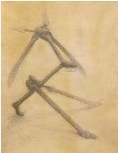
[barruimte] Situation 06 2023 potlood op geprepareerd papier 41 x 31 cm uit de reeks Situations in vitrines