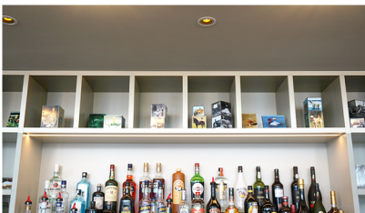
[BAR] - fotokubussen 2024 diverse formaten