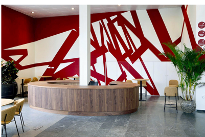
Jasper van der Graaf ZT 2024 acrylverf op wand 4,5 x 14 m