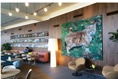
[MUUR 2] - prints op karton 2024 diverse formaten - print op polyester in aluminium frame 2024 270 x 210 x 2,5 cm