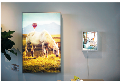
[MUUR 1] - duratrans print in tweedehands lichtbak 2024 154 x 100 x 18 cm - duratrans print in tweedehands lichtbak 2022 50,5 x 40 x 12 cm