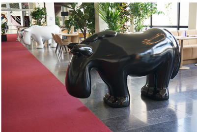
Tom Claassen Zonder titel, 2 ponys wit en zwart 2009/2023 h. 140 cm polyester, verf courtesy Galerie Fons Welters Amsterdam